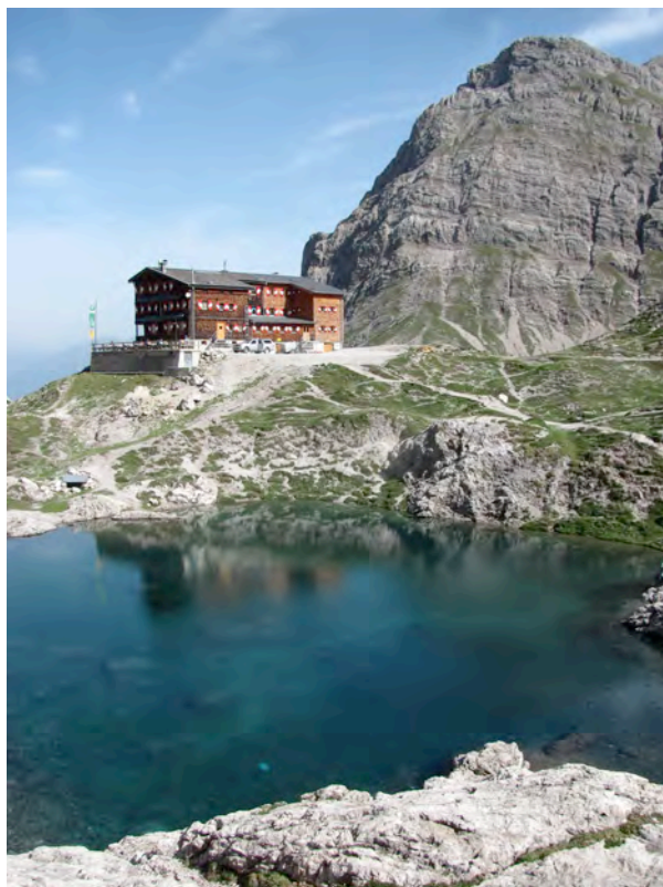
Laserzwand nad kočico Karlsbader Hütte