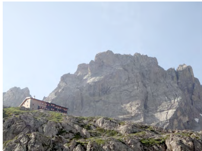
Mogočen Seekofel nad kočo Karlsbader Hütte

Vzpon od izhodišča do koč Karlsbader Hütte je lahek.