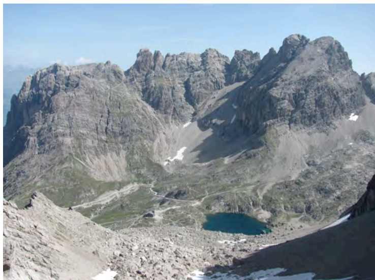
Gore nad Karlsbader Hütte, levo Laserzwand, foto Simon Figar