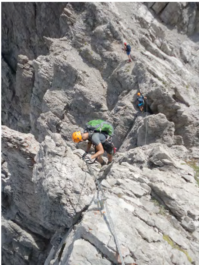
Ferata Seekofel Klettersteig