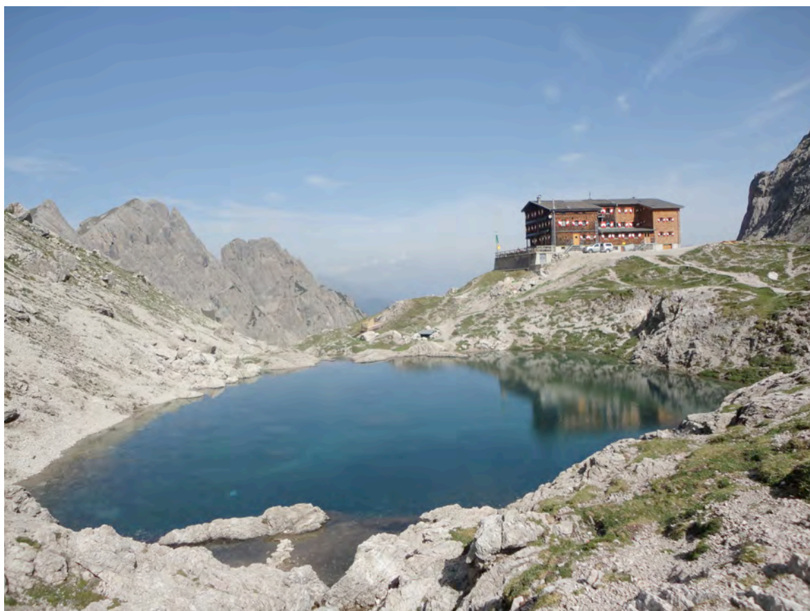
Koča Karlsbader Hütte z jezerom Laserzsee