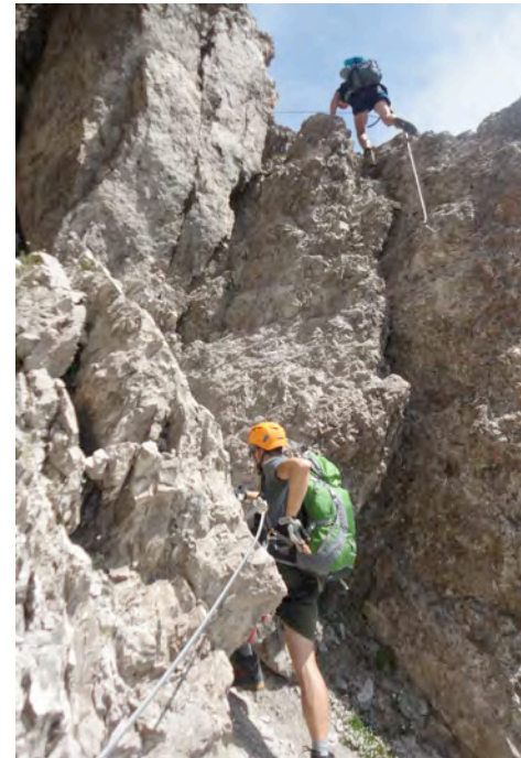
Ferata Seekofel Klettersteig