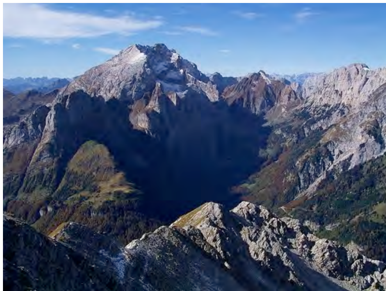
Najvišji vrh Karnijcev – Mt. Coglians s Polinika

Iz Ribnice se bomo peljali prek Cernice, Unca, Postojne do Fernetičev, kjer nas bodo sprejeli prijatelji iz Trsta. Nato pa naprej mimo mest in krajev Udine, Tolmezzo, Forni Avoltri, Collina do parkirišča pri Plan Val di Bos (koča Tolmezzi).